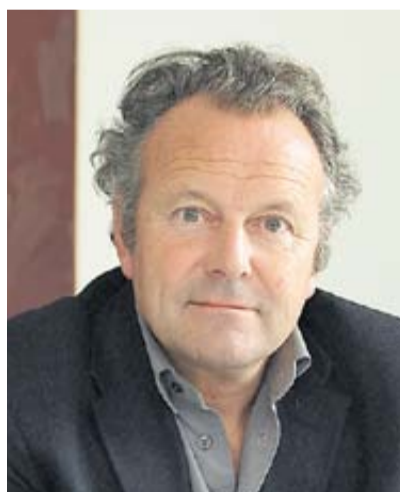
Para su libro, Pieth recorrió el año pasado la mina La Rinconada, en Puno.

Correcto. Pero precisamente utilizo la historia de La Rinconada para resaltar los problemas que existen en la cadena de suministro del oro que llega a Suiza. De modo que visité algunas minas en las que, en principio, decían que trabajan sin mercurio. Pero cuando llegué, unos guardias armados no permitieron hacer fotos