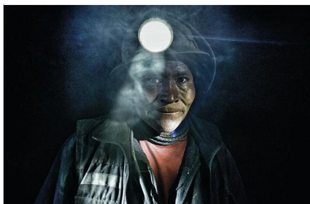
Kleinschürfer im peruanischen La Rinconada: »Ein grauenhafter Ort«

gesellschaften. Allerdings hat das Unternehmen sich bewusst dafür entschieden, seine Arbeit mit artesischen Produzenten unter gewissen Bedingungen fortzuführen, obwohl dies mit Aufwand und Risiken verbunden sei.